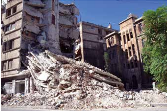
Aleppo: Diese Zerstörung hat das Erdbeben vom Februar 2023 angerichtet ...