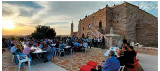
Beim Heiligenfest zu Ehren des Märtyrers Mor Sharbel in Midyat trat auch ein Kinderchor auf.