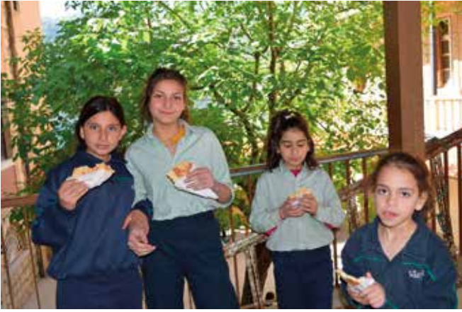
In vielen kirchlichen Schulen finanziert die ICO für hunderte Kinder die Schuljause.

Es gibt zwar im Libanon vergleichbare Einrichtungen, aber keine andere nimmt Kinder schon in so jungem Alter auf wie das „Father Roberts Insitute“ und begleitet die Betroffenen bis zum Uni-Abschluss. Aufgrund der speziellen Bedürfnisse der hier betreuten Kinder und Jugendlichen werden in jeder Klasse nur durchschnittlich vier bis sechs Kinder (max. zehn) unterrichtet. Alle Kinder erhalten auch eine individuelle Betreuung durch verschiedene Spezialisten. Die Eltern der Kinder werden dabei unterstützt, die Gebärdensprache zu erlernen. Aufgrund der schweren Wirtschaftskrise sind die lokalen Spenden fast völlig weggebrochen. Die ICO stellte deshalb einen Betrag in Höhe von 15.000 Euro zur Abdeckung der laufenden Kosten zur Verfügung.