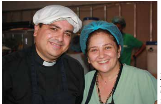
Beirut: In der Marienküche werden täglich bis zu 1.100 warme Mahlzeiten zubereitet.